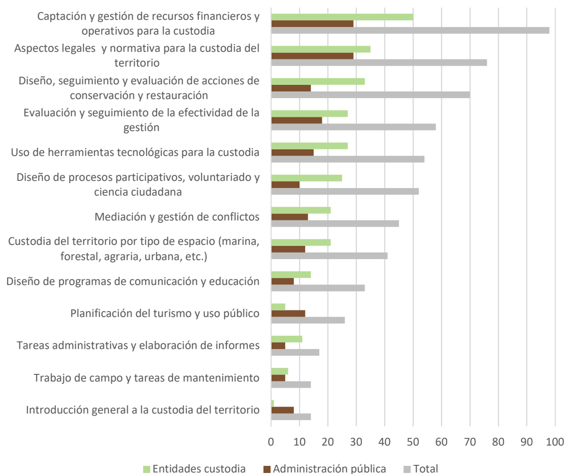
Figura 2. Preferencia de temáticas de formación. Número de personas según colectivo. Cada persona puede marcar hasta 4 opciones.

Los cuatro cursos más demandados son: "Captación y gestión de recursos financieros y operativos para la custodia", "Aspectos legales y normativa para la custodia del territorio", "Diseño seguimiento y evaluación de acciones de conservación y restauración" y "Evaluación y seguimiento"